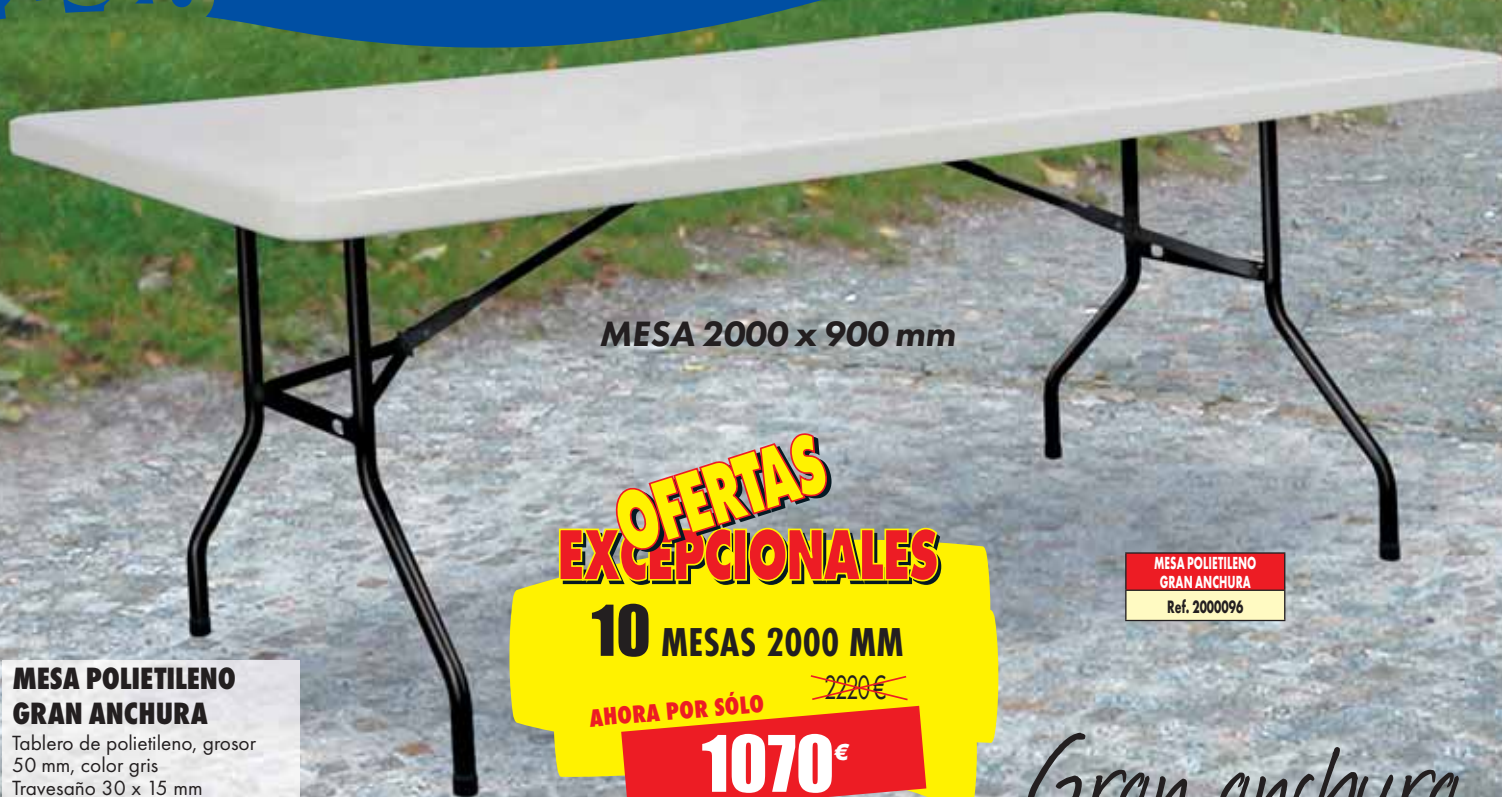
MESA 2000 x 900 mm